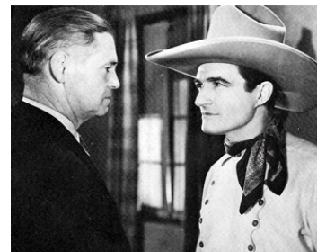
1935 LE CAVALIER MIRACLE (The Miracle Rider) de B. Reeves Eason avec Edward Hearn