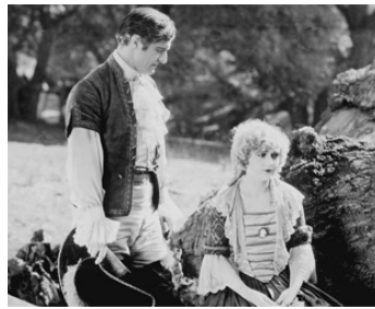
1925 DICK TURPIN (Dick Turpin) de John G. Blystone avec Kathleen Myers