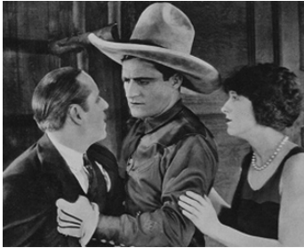
1925 THE EVERLASTING WHISPER de John G. Blystone avec Robert Cain, Alice Calhoun