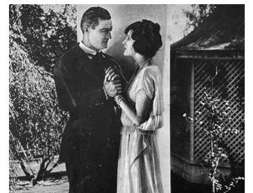
1923 THE LONE STAR RANGER de Lambert Hillyer avec Billie Dove