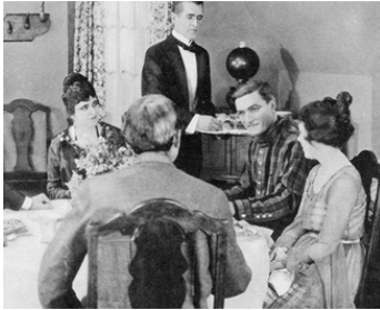
1919 FRÈRES D'EXIL (Fighting for Gold) d'Edward LeSaint avec Teddy Sampson