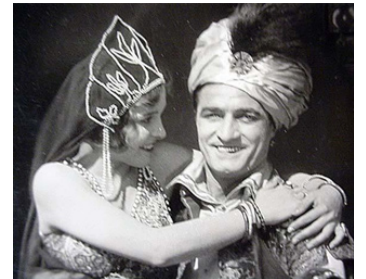
1922 TOM MIX IN ARABIA de Lynn Reynolds avec Barbara Bedford