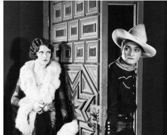
1926 THE GREAT K AND A TRAIN ROBBERY de Lewis Seiler avec Dorothy Dwan