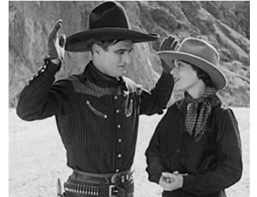
1927 OUTLAWS OF RED RIVER de Lewis Seiler avec Marjorie Daw