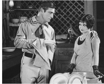
1925 SANS CRIER GARE ! (The Best Bad Man) de John G. Blystone avec Clara Bow