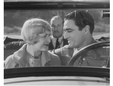
1929 THE BIG DIAMOND ROBBERY d'Eugene Forde avec Kathryn McGuire, Frank Beal