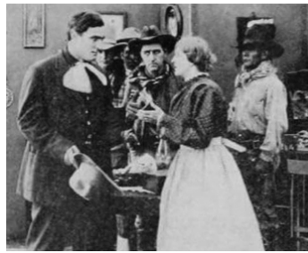
1916 THE SHERIFF'S BLUNDER de Tom Mix avec Sid Jordan, Victoria Forde