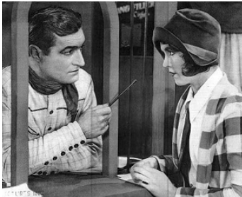
1928 HELLO CHEYENNE d'Eugene Forde avec Caryl Lincoln