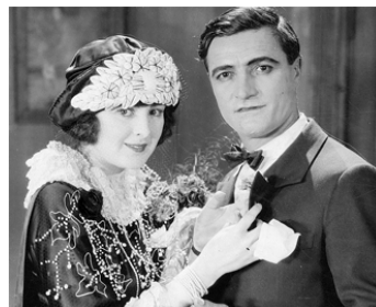
1923 T'EXCITE PAS (Soft Boiled) de John G. Blystone avec Billie Dove