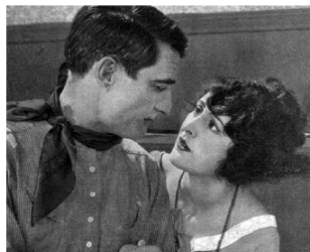
1923 EN TROMBE (Three Jumps Ahead) de John Ford avec Alma Bennett