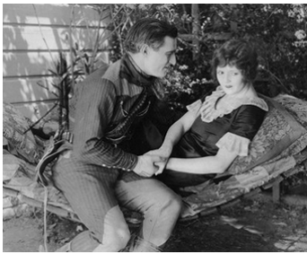
1924 THE DEADWOOD COACH de Lynn Reynolds avec Doris May