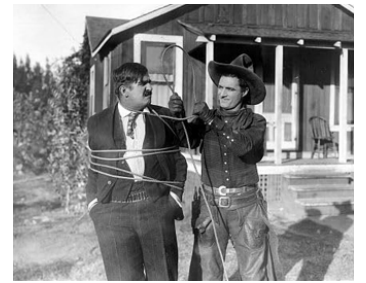
1919 HELL-ROARIN' REFORM d'Edward LeSaint avec Jack Curtis