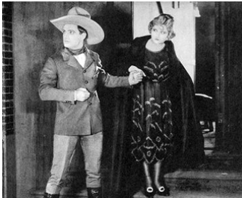
1921 THE ROUGH DIAMOND d'Edward Sedgwick avec Eva Novak