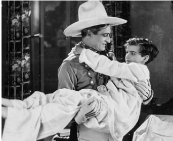
1926 POUR L'ORPHELIN (No Man's Gold) de Lewis Seiler avec Michael D. Moore