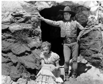
1932 THE RIDER OF DEATH VALLEY de Benjamin Stoloff avec Lois Wilson