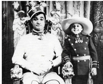
1932 MON COPAIN LE ROI (My Pal, the King) de Kurt Neumann avec Mickey Rooney