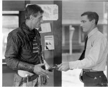
1919 THE COMING OF THE LAW d'Arthur Rosson avec Sid Jordan