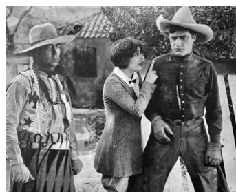
1924 OH, YOU TONY ! de John G. Blystone avec Claire Adams