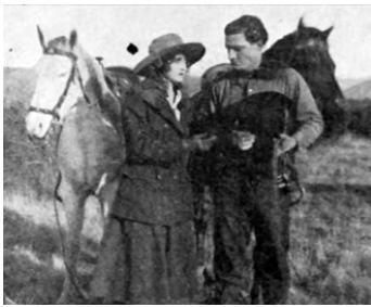
1916 THE PONY EXPRESS RIDER de Tom Mix avec Victoria Forde