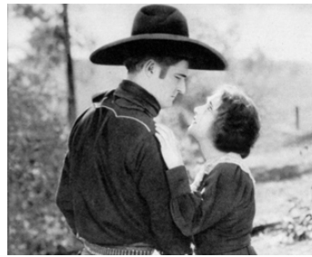
1925 TOM LE VENGEUR (Riders of the Purple Sage) de Lynn Reynolds avec Beatrice Burnham