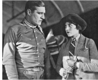
1926 FERME AU POSTE (My Own Pal) de John G. Blystone avec Olive Borden