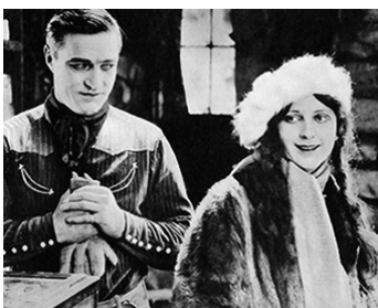
1923 NORTH OF HUDSON BAY de John Ford avec Kathleen Key